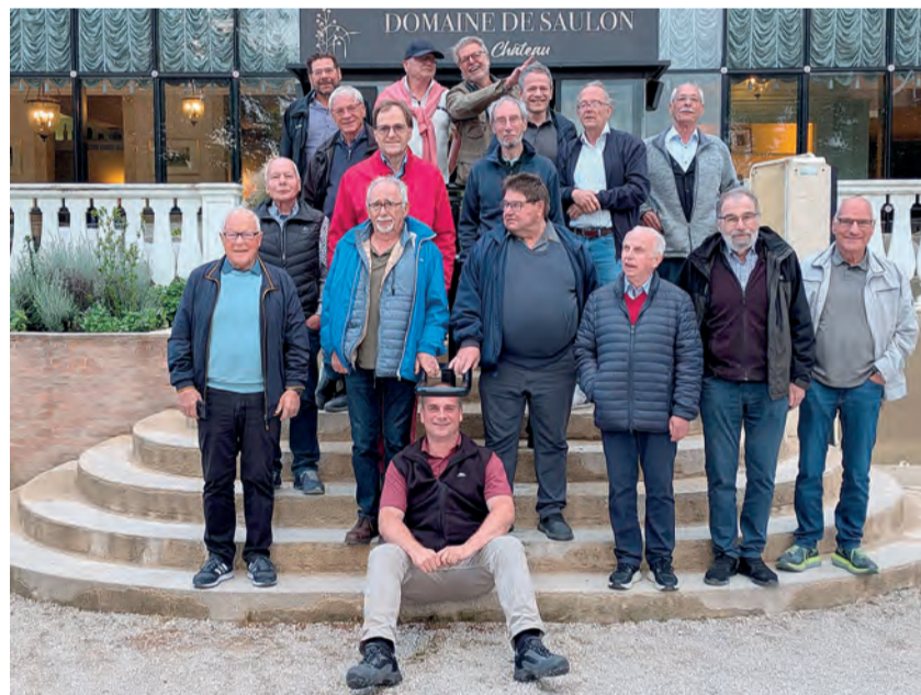
Männerriege Lostorf vor dem Chateau de Saulon

Am folgenden Tag fuhren wir nach Beaune und besichtigten das berühmte ehemalige Spital Hotel Dieu und die Weinkellerei Bouchard Aîné et Fils, wo wir die bekannten Burgunder Weine degustieren konnten. Am Nachmittag besuchten wir das Cassissium wo der beliebte Cassis-Likör produziert wird und natürlich auch hier mit einer sehr sympathischen Degustation, es war toll. Dijon konnten wir von den abendlichen Rundgängen, jedoch mit der kompetenten Führerin «Nicole» konnten wir die Stadt richtig kennenlernen und in der berühmten Markthalle genossen wir einen ausgedehnten Apéro, und die Einwohner waren überrascht über unsern lauten «Santé hoho», fanden es aber lustig, es war einfach schön in dieser Halle. Natürlich besuchten wir auch eine «Moutarderie» und