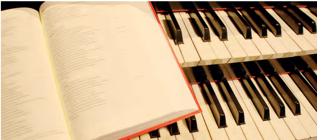
Musik & Wort – Orgelkasten und Bibel in der Kirche

Karfreitag, 17.00 Uhr in der Reformierten Kirche Erlinsbach