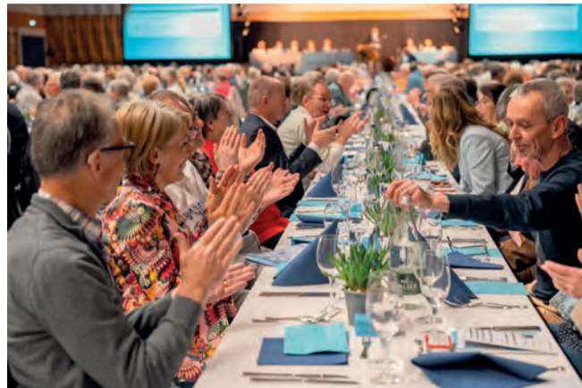
Mehr als 600 Aktionärinnen und Aktionäre besuchten in Erlinsbach die 192. Generalversammlung der Clientis Bank Aareland.

Erlinsbach 27.03.26. Am Freitagabend fand die Generalversammlung der Clientis Bank Aareland statt. Das Aktionariat konnte vom drittbesten Ergebnis der Bank in ihrem 192. Jahr des Bestehens Kenntnis nehmen.