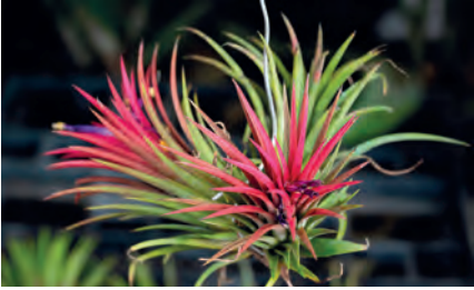
Airpflanzen wie Tillandsien kommen ganz ohne Erde aus und beziehen Wasser sowie Nährstoffe aus der Luft.