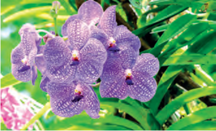
Vanda-Orchideen begeistern mit grossen Blüten und intensiven Farben.