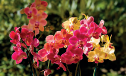
Auch die Phalaenopsis, der Klassiker unter den Orchideen, gibt es in beeindruckender Vielfalt zu bestaunen.