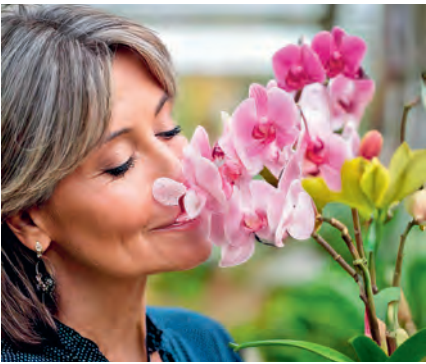
Das Sortiment umfasst viele duftende Orchideen.

www.wyssgarten.ch www.instagram.com/wyssgarten www.facebook.com/wyssgarten