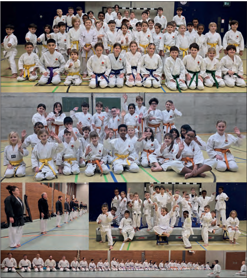
Karate- und Kobudo-Mitglieder der Kampfsportschule Aarau anlässlich der Weihnachtstrainings in Aarau (ohne Bonsai-Karate).

rate-Trainings sind kindergerecht gestaltet durch erfahrene und engagierte Instruktoressen und Instruktorinnen. Kinder sollen stark sein. Nicht nur körperlich, sondern vor allem auch im Kopf. Dies ist eines der Hauptziele des Kinder-Karate-Unterrichts der Karateschule. Denn die Schule ist überzeugt, dass dazu bereits das Kindergarten- und Schulalter massgeblich ist im Hinblick auf die Vorbereitung fürs spätere Leben. Die Kinder stark machen – stark fürs Leben, mit Spass und Freude am Lernen. Dies